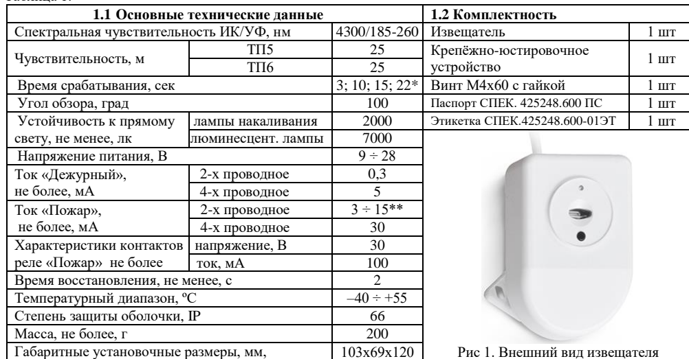
Рис 1. Внешний вид извещателя