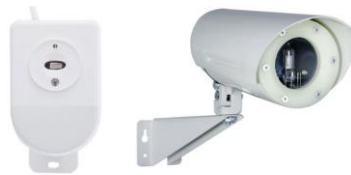
Рис 1. Внешний вид извещателя слева: Спектрон-601 справа: Спектрон-601-М

** - выбор тока осуществляется потребителем