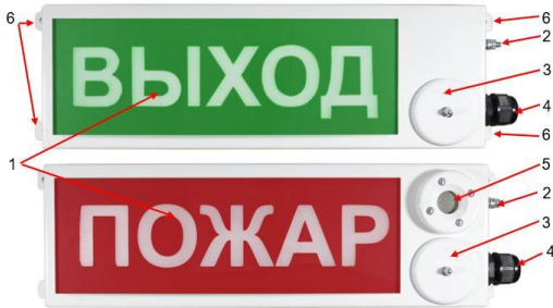
Рис. 1 – Внешний вид оповещателя.

Для заземления предусмотрен специальный болт, расположенный на боковой стороне оповещателя над кабельным вводом. Оповещатель с напряжением питания 220 В, дополнительно имеет клеммы заземления на клеммниках «Питание вход» и «Питание выход».