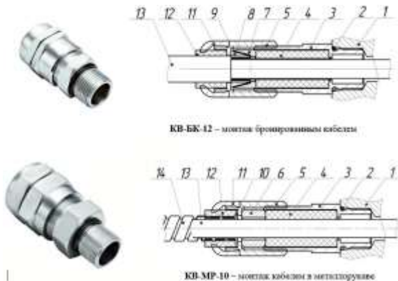
Рисунок 2 – Вводные устройства с двойным уплотнением

Затянуть кабельный ввод до обеспечения герметичности в месте уплотнения.